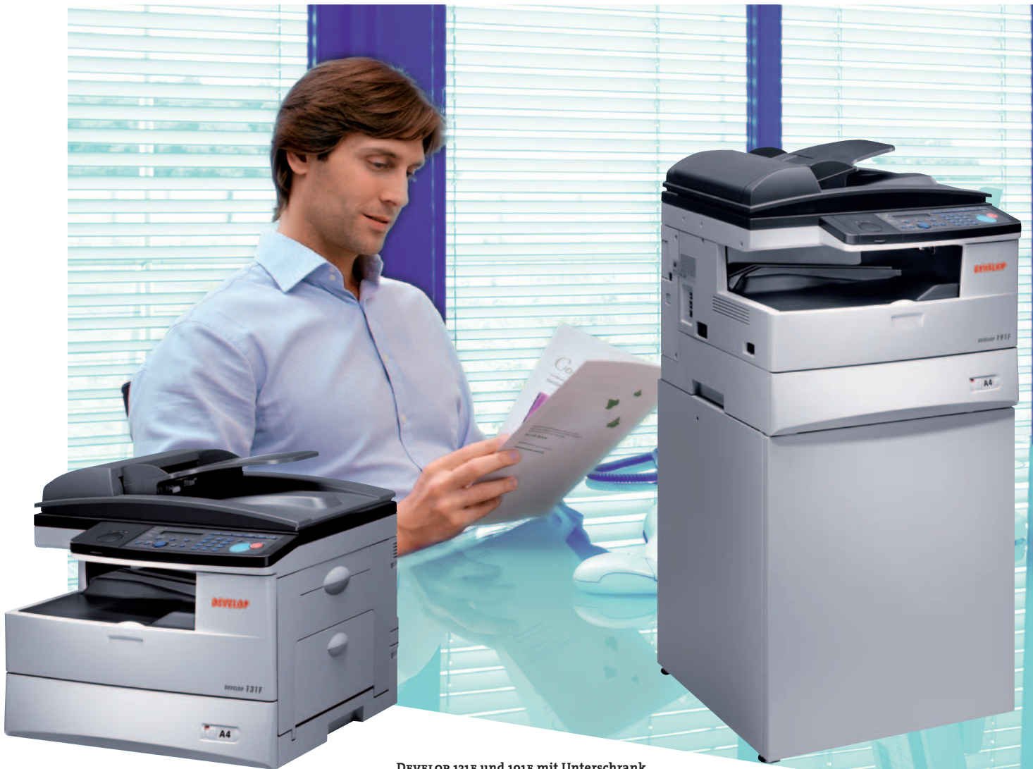
DEVELOP 131F und 191F mit Unterschrank. Dank ihrer modernen Technologie hat die 131F/191F das Potenzial, Arbeitsprozesse zeitlich so zu straffen, dass Kosten spürbar gesenkt werden.