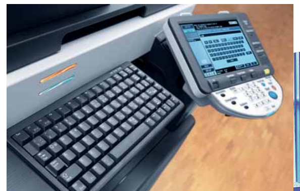
ineo 363 farbiges Touchscreen Display und optionale Tastatur für einfache Eingabe

Profitieren Sie von einem perfekten Team und nutzen Sie die ineo 363 für die Dokumentenproduktion in Schwarzweiß kombiniert mit den ineo+ Systemen für die Erstellung professioneller Farbdokumente.