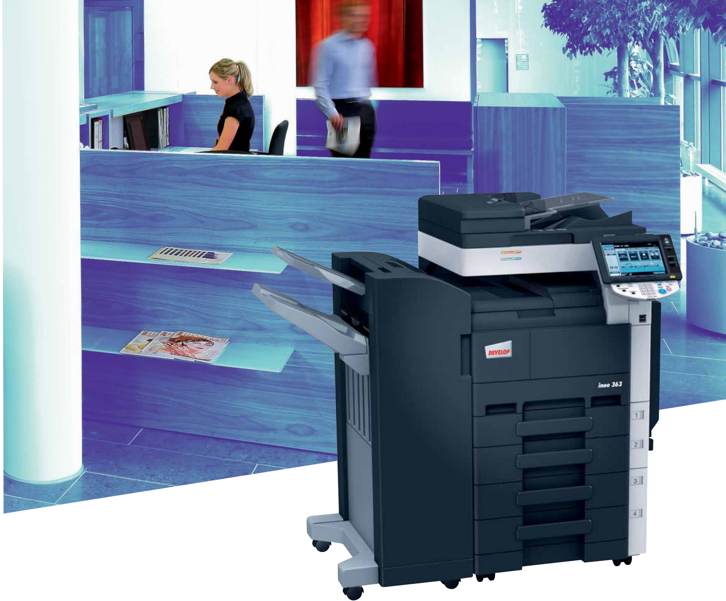
ineo 363 mit Standfinisher (FS-527) und Papierkassette (PC-208)