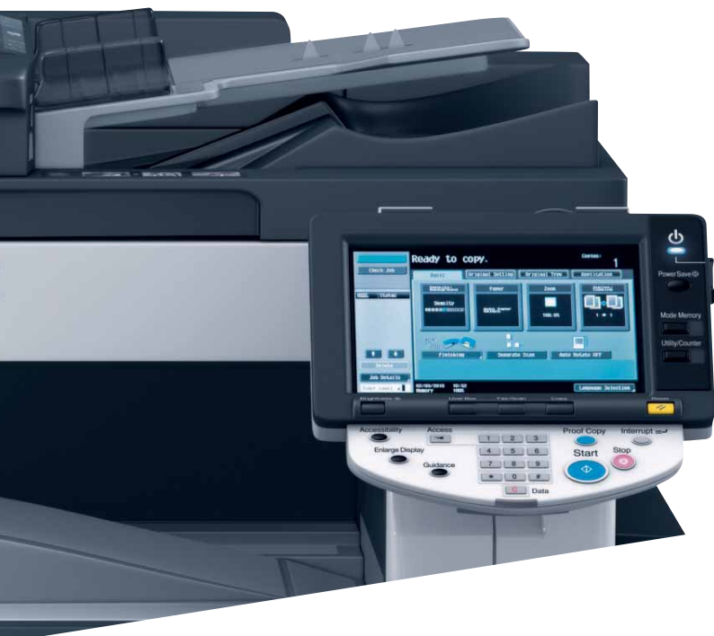
Das leicht bedienbare Farbdisplay der ineo 363

Die hohe Druckqualität in Verbindung mit einer großen Auswahl an Finishing-Funktionen ermöglichen es, selbst höherwertige Dokumente wie Broschüren inhouse zu drucken, zu lochen oder zu heften. Das steigert die Produktivität nachhaltig!